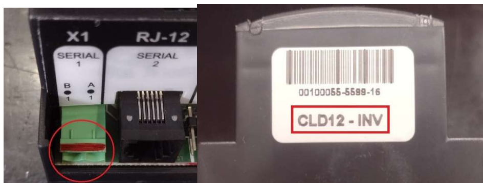
Identificação da CLD e o Lote fabricado com comunicação invertida

No cabo RJ12 (que comunica CLD com IHM) também há uma etiqueta que identifica ele como especial, sendo possível encontrar os modelos B e C, quando não há uma etiqueta no cabo RJ12, este é o modelo padrão (Modelo A).