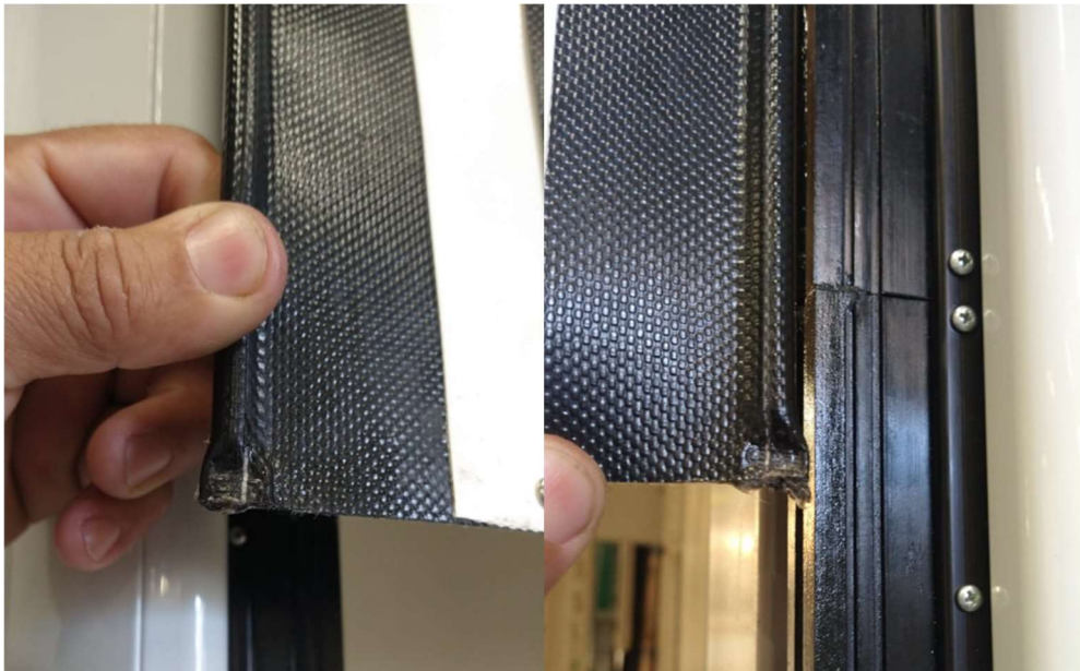
Figura 7 – Perfil após colagem (tempo de cura total da cola é 24Hr), aguardar o máximo tempo possível após a colagem antes de colocar a porta em funcionamento.