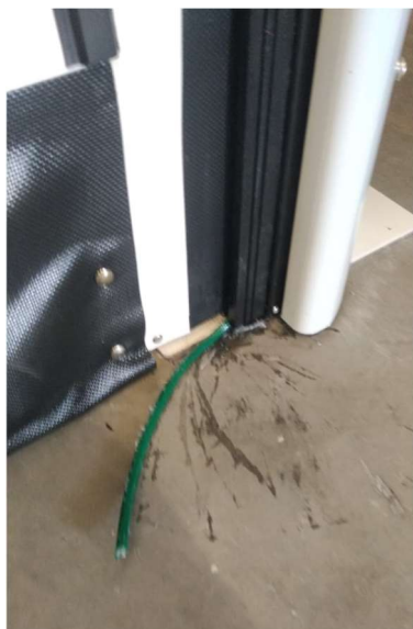
Figura 1 - Problema identificado

Recentemente desenvolvemos um novo perfil para as portas VFX 700 para um modelo mais resistente do tipo overlap, infelizmente por uma falha no processo de solda (por ser um processo novo) acabaram saindo algumas portas sem o fechamento inferior da bolsa do overlap, fazendo com que o perfil escorregue para fora com a movimentação da porta.