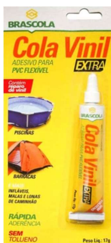
Figura 2 - Cola p/ PVC

Para resolver este problema recomendamos aos instaladores que verifiquem os perfis no PVC das portas VFX 700 recebidas e ao notar que não está fechada a bolsa, fechem com cola de PVC (Cola Vinil p/ Piscinas e lonas) e apertem até que o PVC cole conforme fotos abaixo e depois grampeiem para ajudar a segurar o tarugo.