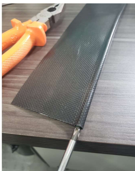
Figura 4 - Empurre cerca de 1cm (10mm) para dentro