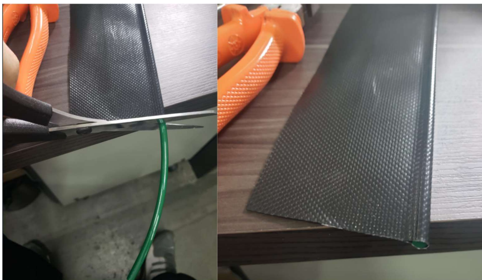
Figura 3 - Recorte o cordão que escorregou