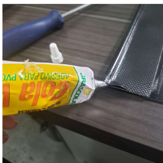
Figura 5 - Aplique fina camada da cola de Vinil nas duas faces do PVC preto e aguarde por aproximadamente 2min.